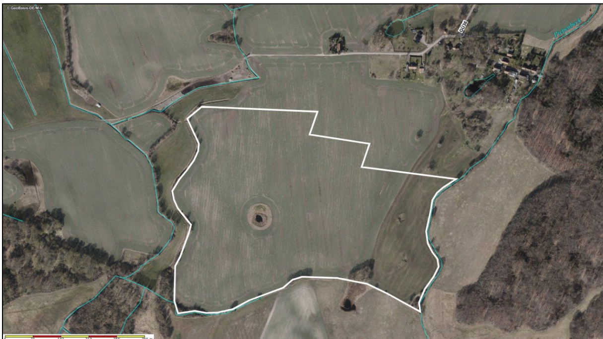
Abbildung 1: Luftbildauszug des Planungsraumes; ( https://www.geoportal-mv.de/gaia/gaia.php )

Die vorhandenen Geländehöhen sind als relativ eben zu beschreiben. Die Höhen variieren von 15 m NHN im Westen bis zu 22,5 m NHN im Osten des Geltungsbereiches, wobei der Graben an der östlichen Geltungsbereichsgrenze sich auf einer Geländehöhe von 17,5 m befindet. Im Bereich des Dauergrünlands befindet sich ein Os, welches eine wallartige Geländeerhebung aus Sand und Kies ist, dass durch die glaziale Serie entstanden ist.