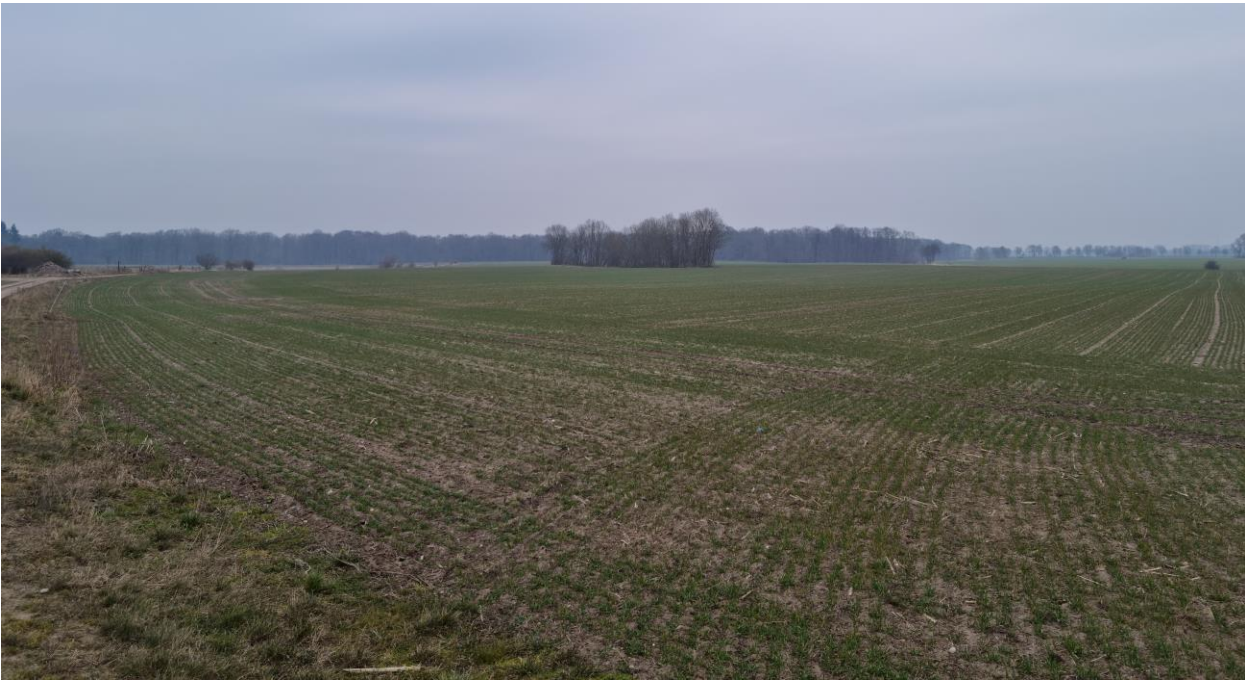
Abbildung 4-1: Aktuelle ackerbauliche Nutzung im Untersuchungsgebiet

PVA scheinen demgegenüber für Greifvögel im Vergleich zu Ackerflächen wieder Vorteile zu bieten. So wurden Turmfalke und Rotmilan auf der aktiven Nahrungssuche in PVA beobachtet (MONTAG et al. 2016, DWYER et al. 2018). Dieses Verhalten gilt offenkundig auch für den Schreiadler: „Sie jagen im unmittelbaren Randbereich und führen auch Jagdflüge über ca. 20 m breite Grünlandstreifen innerhalb der PV-Anlagen aus [...] Ein Grund dafür ist sicher auch, dass PV-Anlagen in der Regel mit Grünlandstreifen eingefasst werden, welche Refugien der Feldmaus darstellen und Kleinsäuger jagende Greifvögel regelrecht anlocken.“ (SALIX 2020).