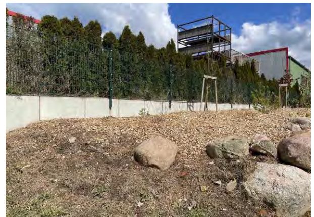
Abb. 8 u. 9: Links und rechts: Lagerfläche und Gehölzpflanzung am südlichen Rand des Plangebietes, angrenzend an das Baufeld 2