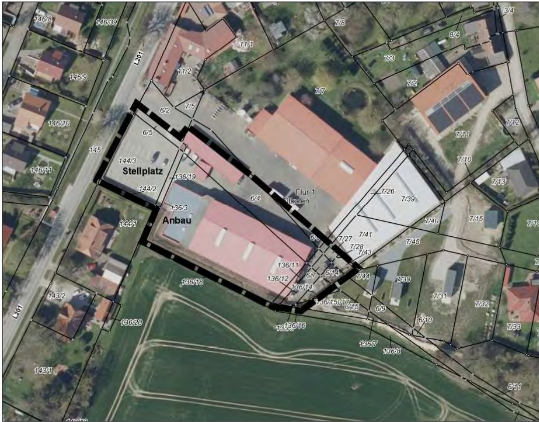
Abb. 2: Luftbild vom Plangebiet

In der Abbildung 3 sind die Änderungen des B-Planes zusammenfassend dargestellt.