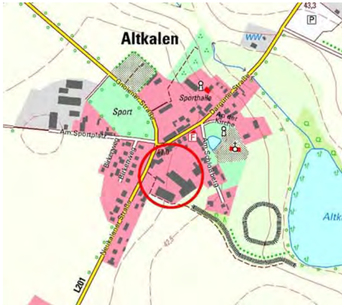
Abb. 1: Lage des Plangebietes (roter Kreis)