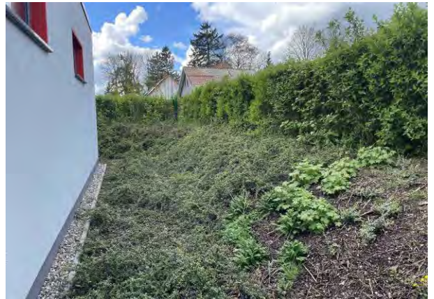
Abb. 6 u. 7: Links: Anbau mit Sozial- und Büroräumen; rechts: Gehölzpflanzung westlich vom Anbau