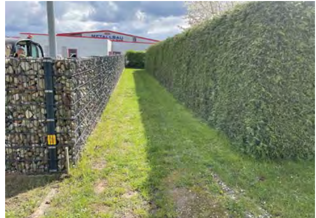
Abb. 10 u. 11: Links und rechts: Feldsteinmauer entlang des Mitarbeiterstellplatzes (westlich und südl.)