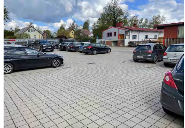
Abb. 4 u. 5: Links und rechts: Mitarbeiterstellplatzfläche